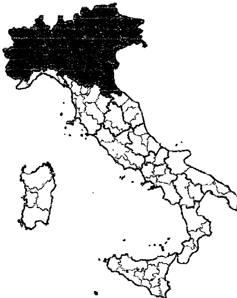
Figura 1 - Territori stagionalmente liberi per il periodo dal 13 dicembre 2004 al 28 febbraio 2005.